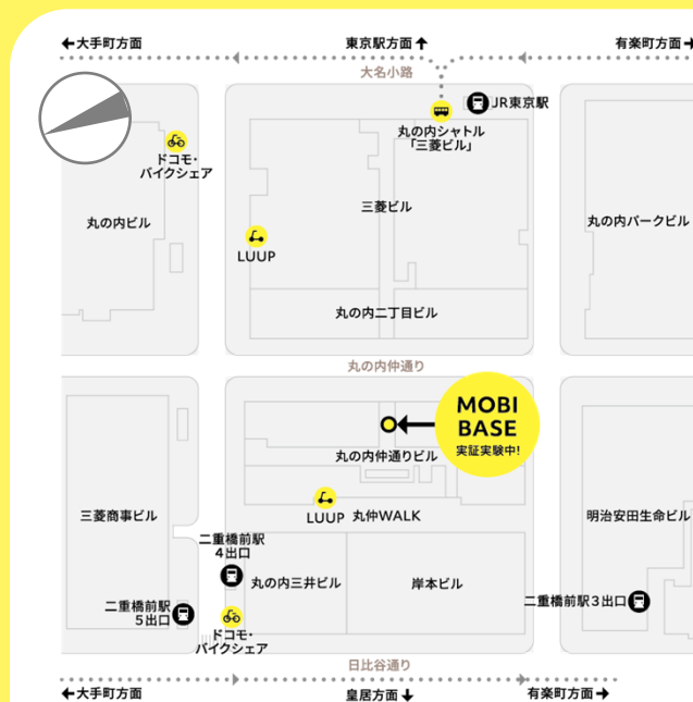
【MOBI BASE 位置図】

日の丸自動車興業株式会社、株式会社Luup、株式会社ドコモ・バイクシェア 東京建築祭 実行委員会、一般社団法人 TMIP、三菱地所株式会社、回遊カード掲載の各施設