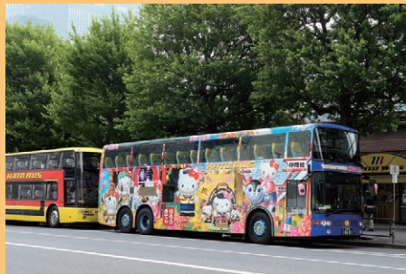
© 1976,2009 SANRIO CO.,LTD. APPROVAL No.00661504