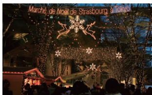
上:光都東京・LIGHTOPIA2010 下:ストラスブールのマルシェ・ド・ノエル