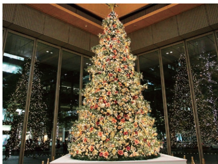
丸ビルMARUCUBEのクリスマスツリー(2010年度のもの)

丸の内仲通りを中心に、街がきらめく「丸の内イルミネーション」。昨年は丸ビルのMARUCUBEに8メートルものクリスマスツリーが設置され、東京国際フォーラムでは本場フランスのクリスマス・マーケット、ストラスブールのマルシェ・ド・ノエルが賑わいをみせた。そして光都東京では、多様な光の世界が繰り広げられた。